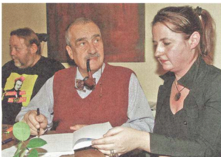
Křest knihy Milý pane kniže – Karlu Schwarzenbergovi k 75. narozeninám.

Co vás vedlo k výběru česko-anglické základní školy?