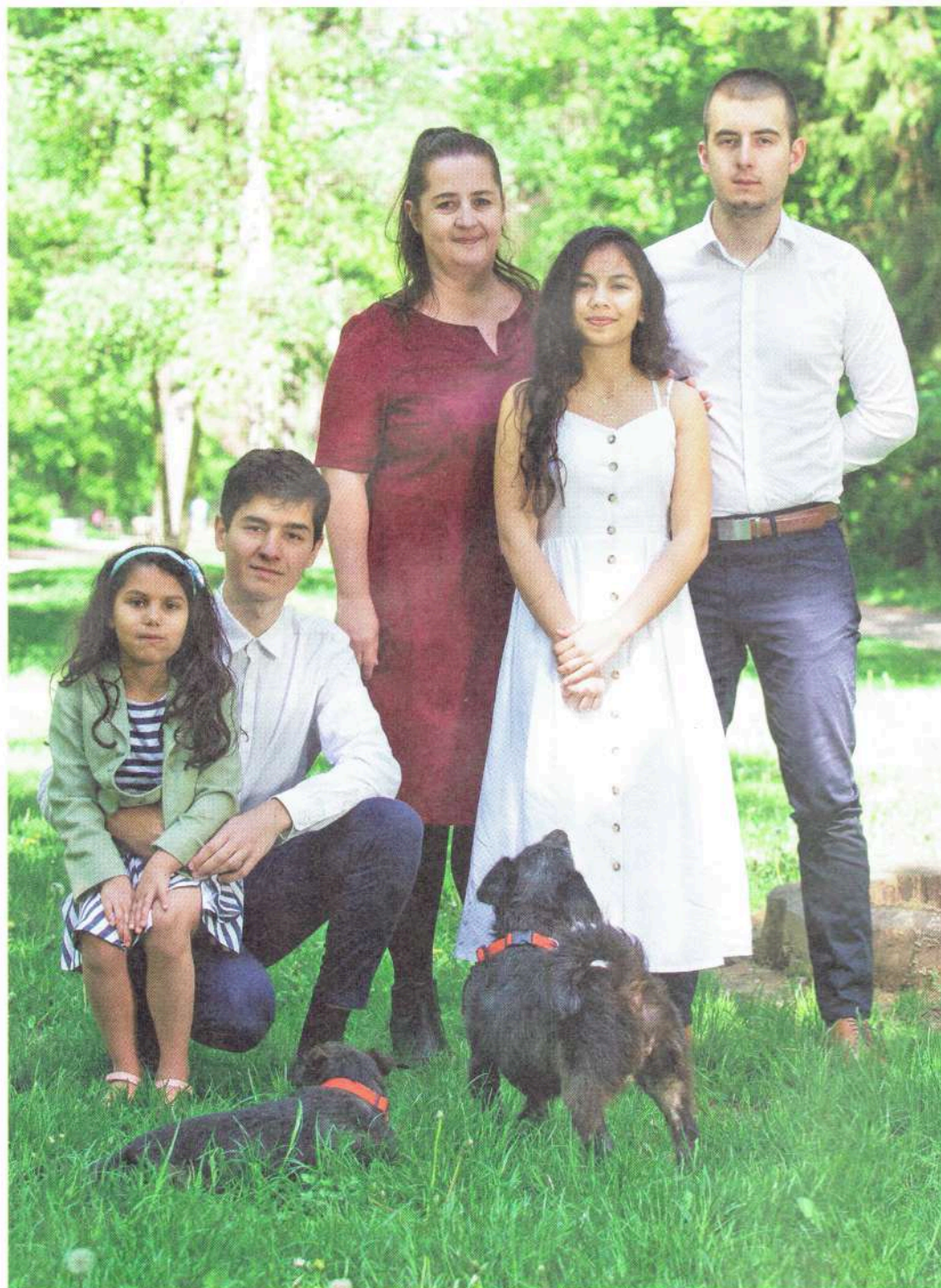
Touha po velké rodině. Ke čtyřem dětem možná přibudou další dvě ze Sýrie.

V takových případech je to komplikované, ale nikoli nemožné. Ještě