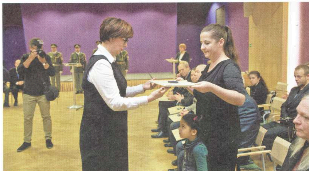
Osvědčení pro účastníka odboje a odporu proti komunismu převzala v roce 2016.