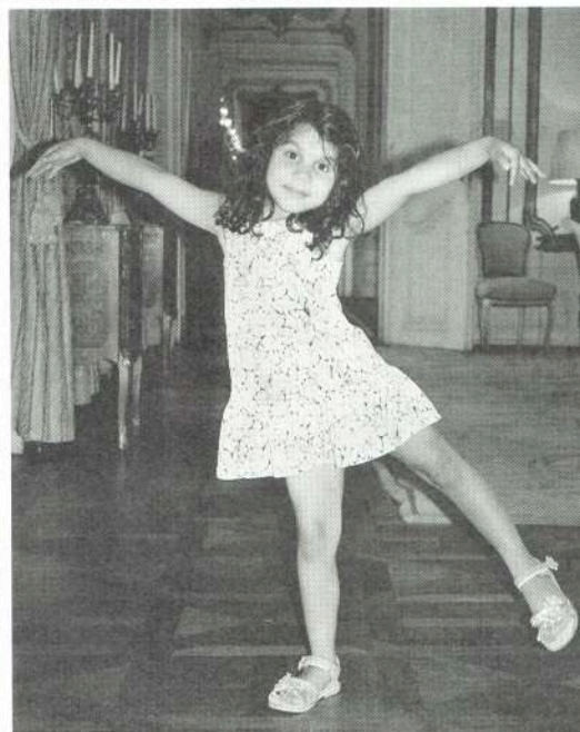
Osvojená Vanesska je pohybově nadaná.

než ve skutečnosti. Ne tak Václav Havel.